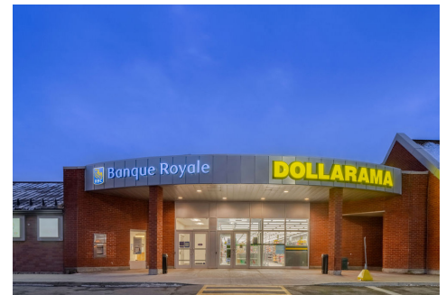
RBC & Dollarama