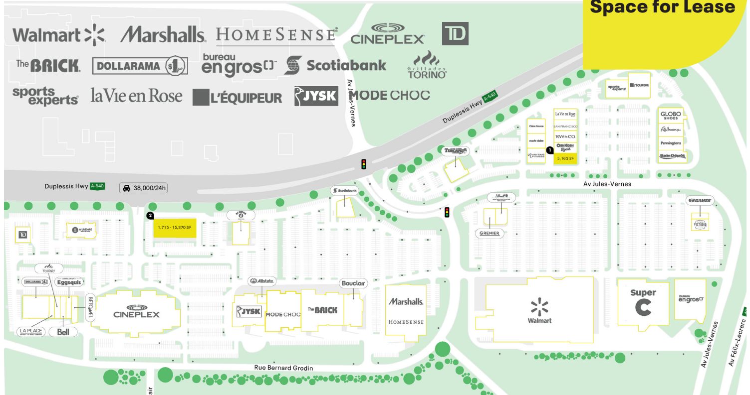
Plan de site - Site Plan