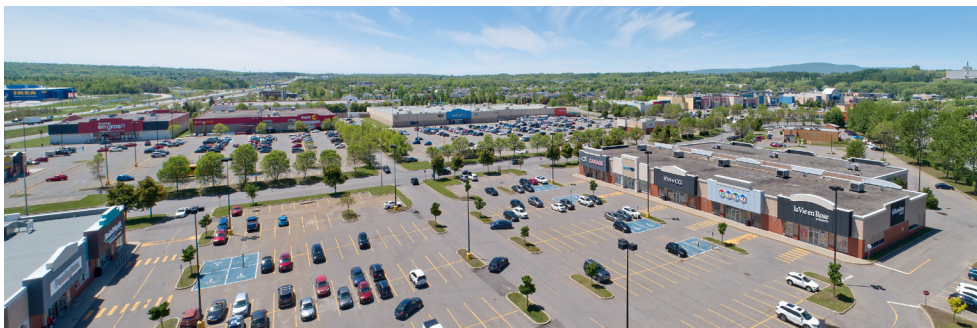
Vue aérienne du Méga Centre Ste-Foy - Méga Centre Ste-Foy aerial view