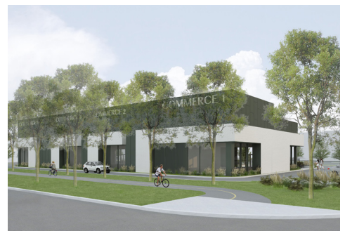
Redéveloppement (arrière) - Redevelopment (back)