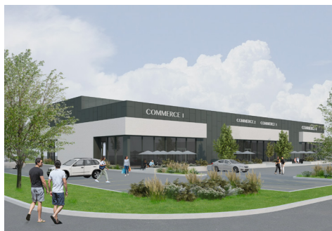
Redéveloppement (devant) - Redevelopment (front)