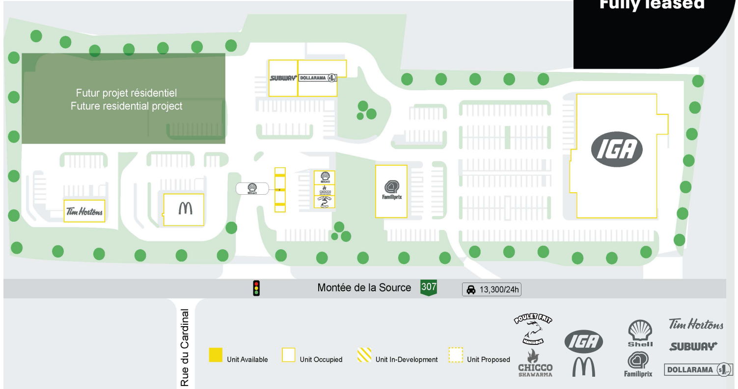
Plan de site - Site Plan