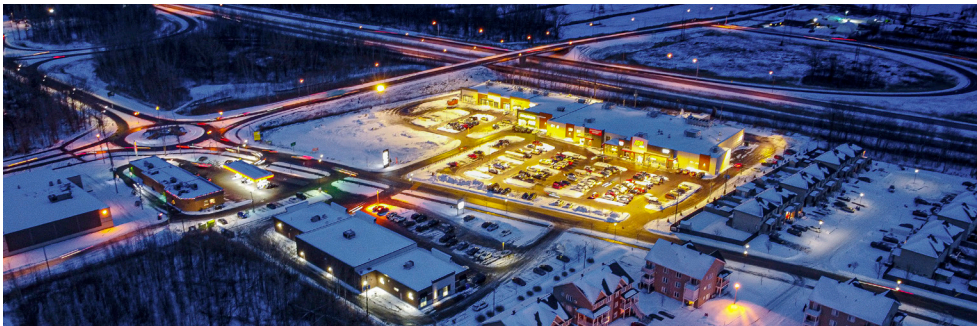
Vue aérienne du Marché Contrecœur - Aerial view of Marché Contrecœur