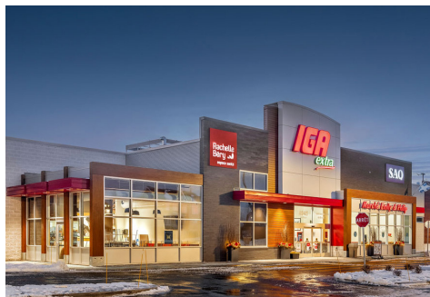
IGA Extra Marché Contrecœur