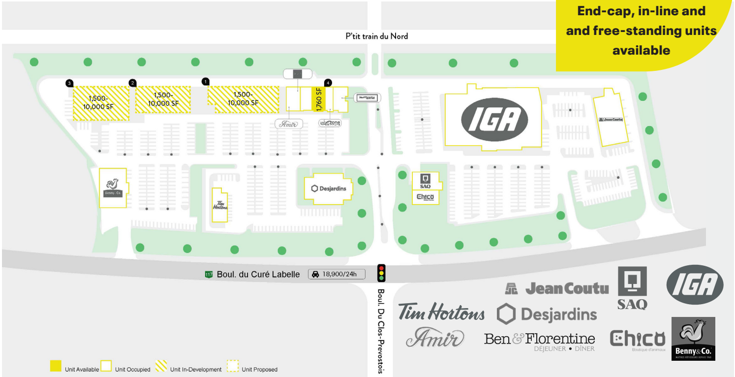
Plan de site - Site Plan

Unités de coin, en ligne et bâtiments indépendants disponibles End-cap, in-line and and free-standing units available