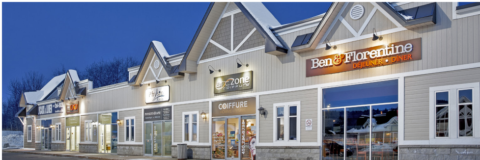
Vision F&G - Art Zone coiffure - Ben & Florentine