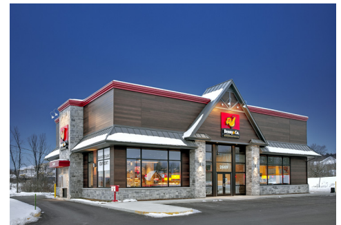
Benny & Co