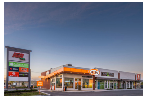
A&W, Pattes et Griffes, Benjamin Moore, Salvatoré