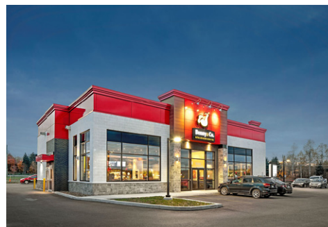
Benny & Co