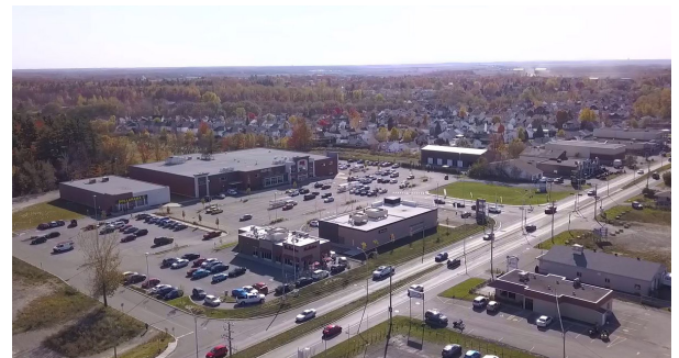
Vue aérienne - Aerial view