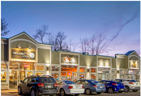
Sushi shop, Boutique Table top, Happy Montreal