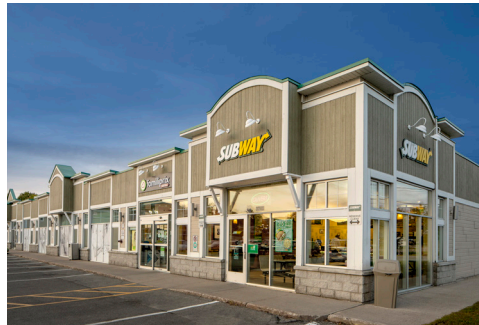
Subway, Famiprix, Ongles & Spa Kadie, SAQ