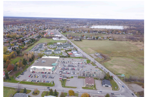
Vue aérienne - Aerial view