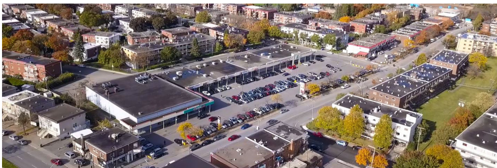
Vue aérienne - Aerial view