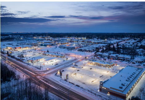
Vue aérienne - Aerial view