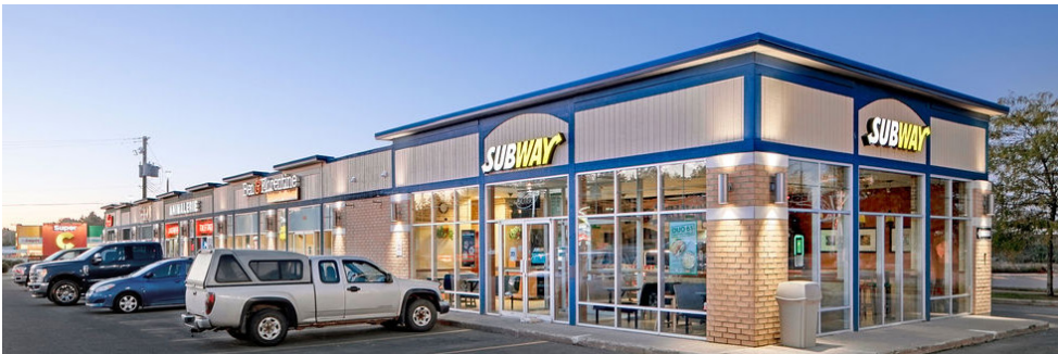
Amir, Animalerie, Ben & Florentine, Subway