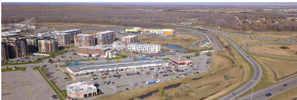
Vue aérienne du Marché Lachenaie - Aerial view of Marché Lachenaie