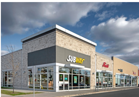
Subway, Amir, Sushi Shop, Quesada