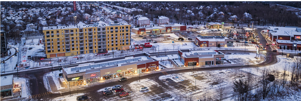
Vue aérienne - Aerial View