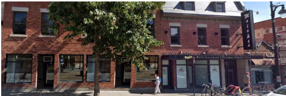
Illustration à titre d'information - Illustration for informational purposes