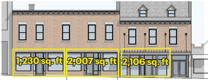
Façade de Moishes - Moishes Façade